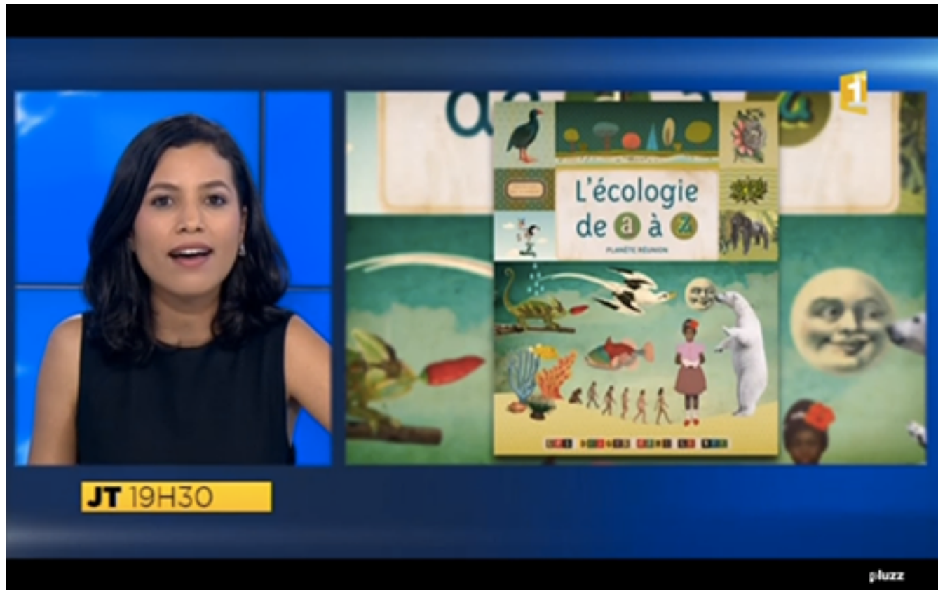
Journal télévisé du 30 aout 2014