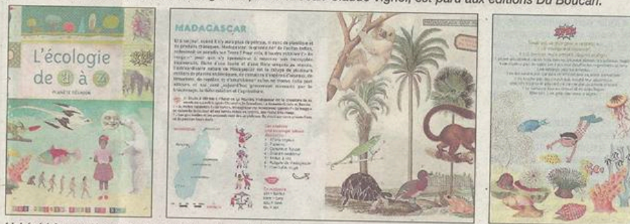
L'abécédaire est désormais disponible dans toutes les librairies de l'île.