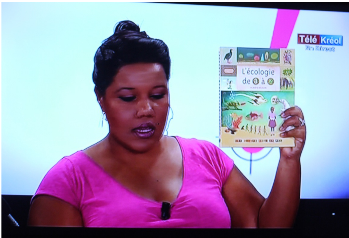
Nou la fé : émission du 13 mars 2014